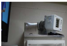
抗ウイルス除菌用照射装置