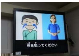
多言語対応 検査ナビ