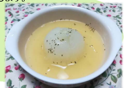
とても柔らかく、甘くておいしいです🍷